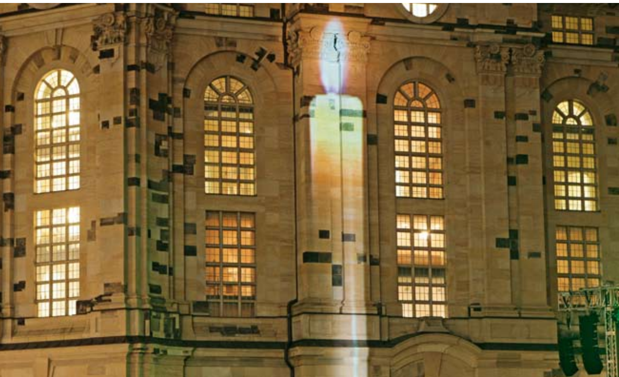
Lichtprojektion einer Kerze und Anstrahlung des Turmkreuzes zum Gedenken