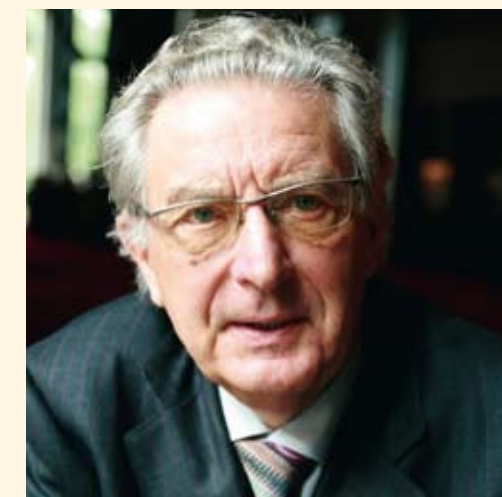
Gerhart Baum, Bundesinnenminister a. D., hält am 13. Februar die Gedenkrede vor der Frauenkirche.